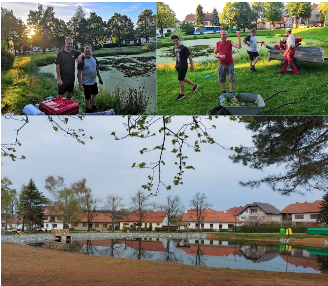
Fotografie zachycující proměnu malého rybníčku

Ted' už si jen počkat, jak se okolí zazelená.