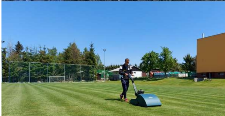
Nově zrekonstruované hřiště za kulturním domem