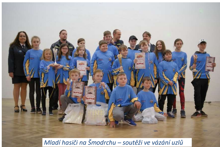
Mladí hasiči na Šmodrchu – soutěži ve vázání uzlů