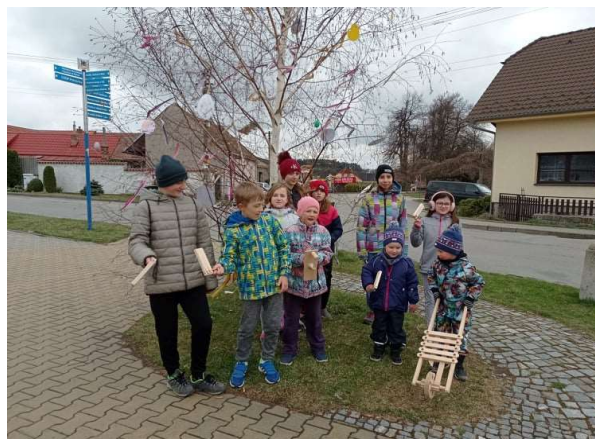
Momentka z letošního hrkání

V roce 2021 knihovnu navštěvovalo 35 registrovaných čtenářů, většina z řad starší a střední generace. Bohužel zájem mládeže a dětí o čtení je velmi malý. V průběhu roku bylo půjčeno 604 knih.