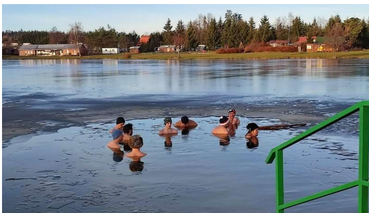
Každodělní ranní koupel