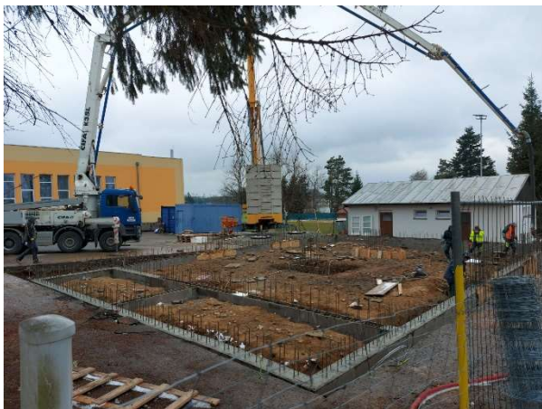
Probíhající výstavba hasičské zbrojnice.

Dále musíme připočíst technický dozor, bezpečnost práce a projektovou přípravu. Celková částka je tedy 24 mil Kč.