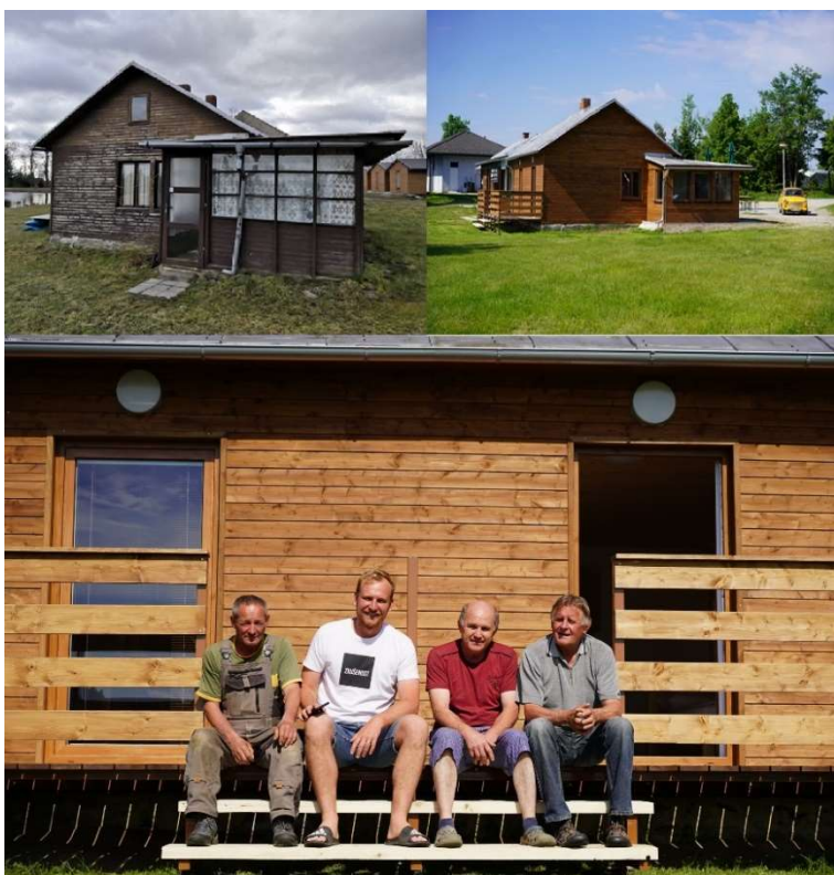
Fotografie zachycující proměnu ubytování na loděnici, kde vznikly dva nové apartmány včetně sociálního zázemí