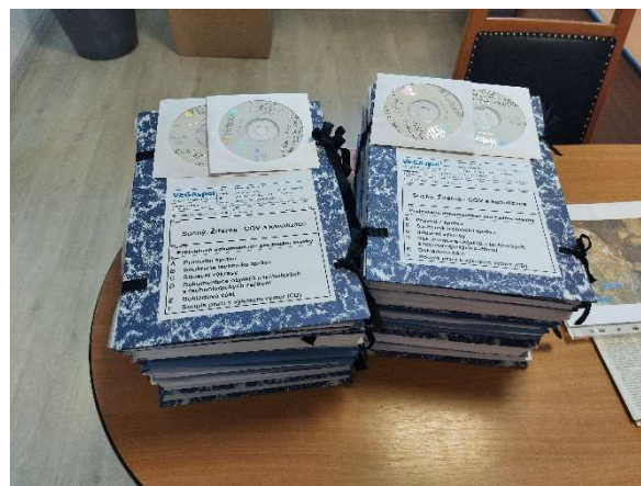
Vytištěná projektová dokumentace ČOV a kanalizace

Jedná se o stavbu, jejíž vysoutěžená cena činí 1/4 miliardy. Stavba, která bude pro naši obec velkou výzvou, a to nejen z ekonomického hlediska. Dva roky bude ochromen život v obci, v zimě bahno, v létě prach, budou se komplikovat přístupy k nemovitostem, budou objížďky, všechno bude rozbité, budovy se budou muset přepojovat na novou kanalizaci. Zkrátka to pro nás všechny bude hodně náročné období.