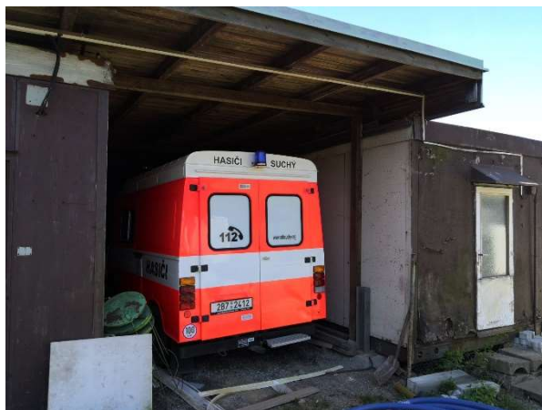
Původní zázemí pro jedno z hasičských vozidel

Důvod, který ovšem nejvíce rezonuje v zastupitelstvu, je skutečnost, že hasiči si za svoji dlouhodobou činnost opravdu zaslouží prostory odpovídající dnešním standardům, které jim slibujeme už několik let a jsme v tomto ohledu pozadu za ostatními obcemi.