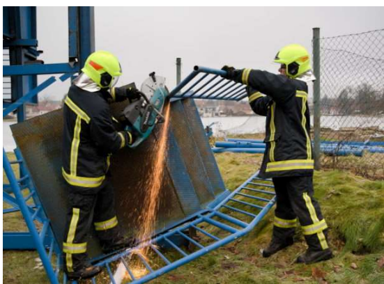
Naši hasiči při práci na demolici tobogánu