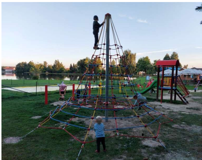
Nové dětské hřiště na velenovské straně rybníka