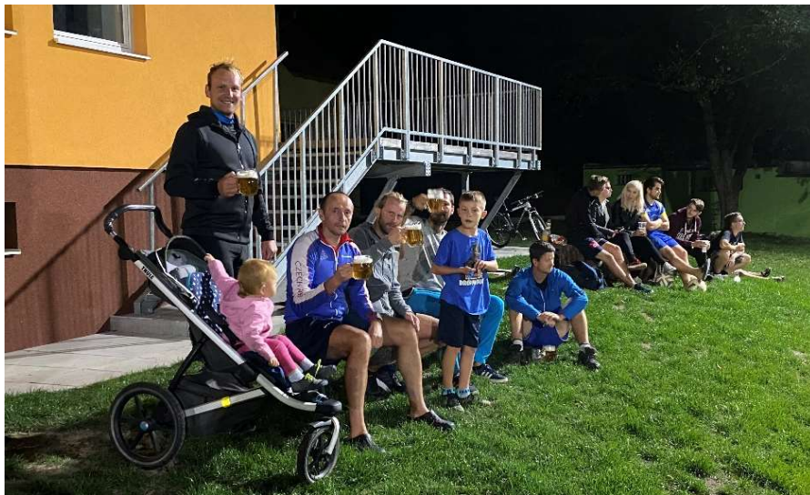
Hráči suchovské rezervy při sledování zápasu A týmu a taktické přípravy na vlastní zápas

Ročník 2021 nebyl jen o A týmu a nejvyšší okresní soutěži. Svou premiéru si připsal i nově vzniklý „B“ tým, kde se skloubilo dravé mládí a zkušenosti. Nově vzniklý tým hledal svou tvář, a tak si první bod do tabulky připsal až ve 4. kole po remíze s týmem DL Lysice 2:2, ovšem hned v dalším kole poprvé hráči okusili pocit vítězství, když zvítězili nad B týmem Karolína 4:2. Celkově v jarní části sezóny tým za dvě výhry, dvě remízy a pět porážek posbíral 8 bodů. V odvetách se tým dlouho nedokázal prosadit a i přes zlepšené výkony oslavil vítězství až v pátém zápase, kdy podruhé v sezóně porazil tým Karolín „B“ 4:2. Do konce sezóny se podaří porazit ještě týmy Brněnce (4:3) a Olešnice 5:1 a nasbírat dohromady 17 bodů, které stačily na hezké 7. místo nejnižší soutěže.