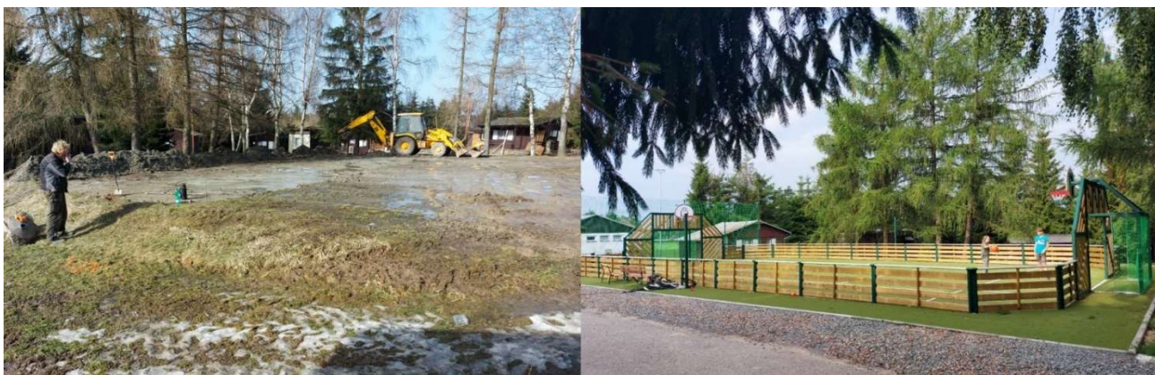
Fotografie zachycující proměnu hřiště v chatové osadě

Během minulého roku se povedlo vystavět nové multifukční hřiště v areálu chatové osady. Výstavba umělého hřiště přišla na 2,4 mil. Kč. Na stavbu se nám podařilo získat dotaci z Ministerstva pro místní rozvoj ve výši 1,7 mil. Kč. Jak se projekt povedl, můžete zhodnotit na obrázku níže.