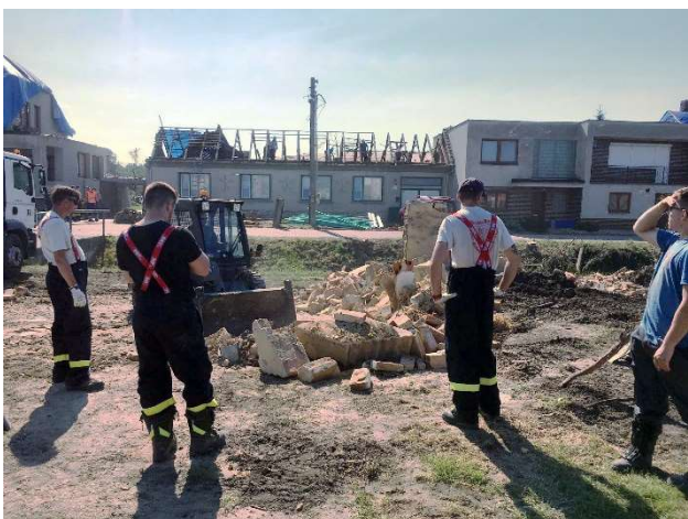
Fotografie zachycující naše hasiče při likvidaci následků tornáda.

Jednotka vyjela v roce 2021 k 11 událostem. Jednalo se hlavně o odstraňování následků působení přírodních živlů, a to nejen u nás v obci. Naši členové byli dvakrát vysláni na likvidaci následků tornáda na jižní Moravě, konkrétně do obce Hrušky. Domů se pak vraceli nejen fyzicky vyčerpaní, ale také s psychickým zážitkem, na který asi jen tak nezapomenou.