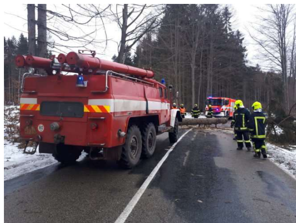
Fotografie ze zásahu při odstraňování následků vichřice.

Aby mohli tyto těžké situace zvládat, musí procházet pravidelnou přípravou. Nejlepší je vždy spojit příjemné s užitečným, a tak například při úpravě ledu na rybníce proběhl nácvik hašení pomocí čerpadla ve vysokých mrazech, kdy se teplota pohybovala kolem -15^{\circ}\text{C} , nebo při likvidaci konstrukce tobogánu zase členové jednotky vlastními oprávnění k práci s motorovou rozbrušovací pilou prodělali povinný praktický výcvik.