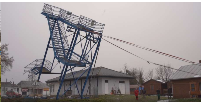
Konstrukce tobogánu padající k zemi