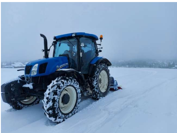
Zapojení obecní techniky při vyjíždění lyžařských tras

Na zastupitelstvu probíhaly diskuse o možném nákupu frézy. Cena se pohybuje okolo 320 000 Kč bez DPH. V zásadě se všichni zastupitelé shodli na tom, že projekt údržby tratí a s tím spojené investice do techniky je ukázkový příklad projektu, který přesahuje působnost o úkoly obecní samosprávy a měl by být tedy podporován krajem.