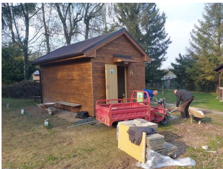
Fotografie zachycující naše zaměstnance při práci na rekonstrukci chatky

Za poslední 3 roky jsme jen do obnovy našich ubytovacích kapacit nainvestovali cca 3 mil. Kč a opravili 14 objektů k pronájmu. Ve všech případech se jedná o téměř nové objekty, žádné převlečené mrtvoly.