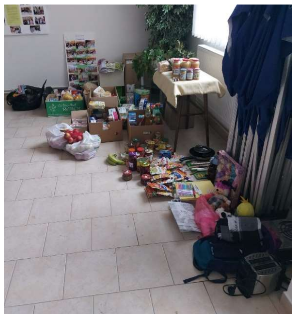
Sběrné místo materiální pomoci na chodbě OÚ

O týden později jsme na Suchým poskytli zázemí sedmi rodinám z Ukrajiny. V současné době, kdy píšu tento článek, je u nás ubytováno 22 osob, 11 dospělých z toho 10 žen a 11 dětí.