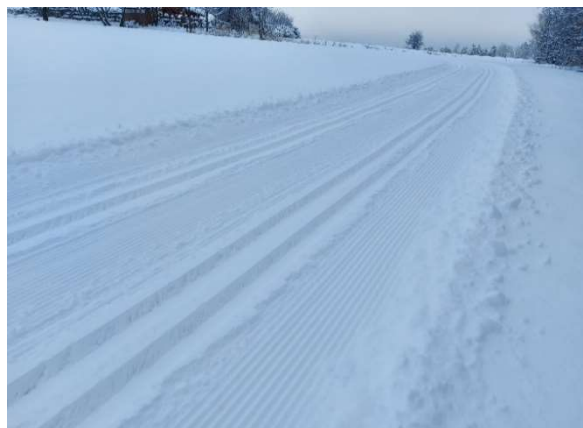
Čerstvě upravená lyžařská trasa

Je pravdou, že jsou zimy, které běžkování přejí a také zimy, kdy se u nás běžkovat skrz nedostatek sněhu prostě nedá.